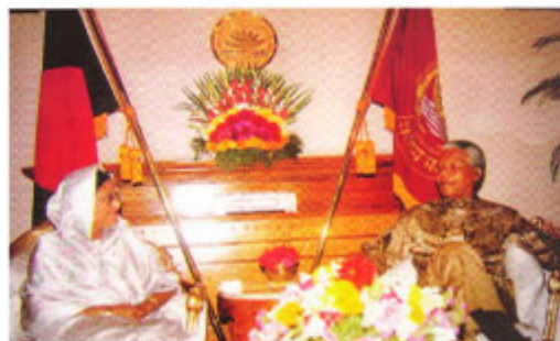
Ex. President Nelson R. Mandela visited Bangladesh on 25-27 March 1997 to attend the silver jubilee celebration of Bangladesh. During the visit Hon'ble Prime Minister Sheikh Hasina had discussion with the great leader of South Africa

Over the years, bilateral cooperation between the two countries had continued to grow steadily in depth and dimension. Friendship and multi-faceted cooperation between the two Commonwealth countries have continued to grow strength to strength. Our common priorities and shared perspectives have strengthened our collaboration in the UN and other international and regional forums. Today, both Bangladesh and South Africa are active, contributing members of the international community.